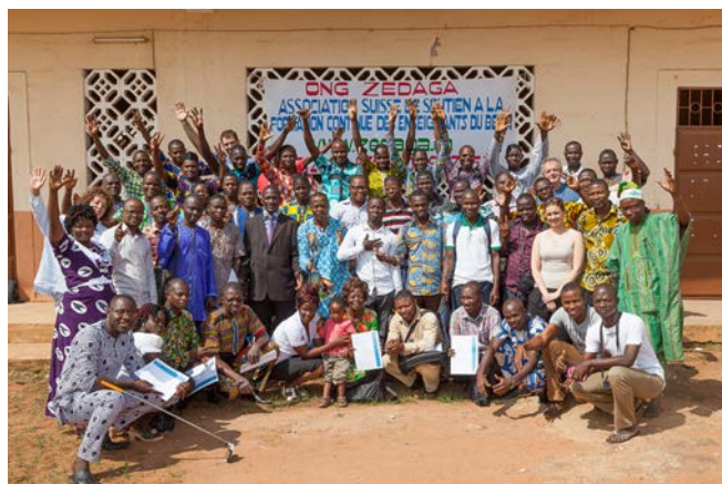
Groupes d'enseignants lors de la cérémonie de remise des attestations de la formation de juillet 2016 à Allada