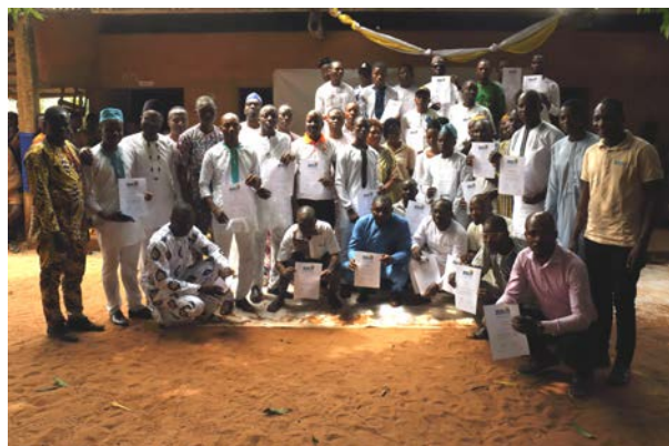
... aux enseignants de Toffo (Atlantique) en informatique ...