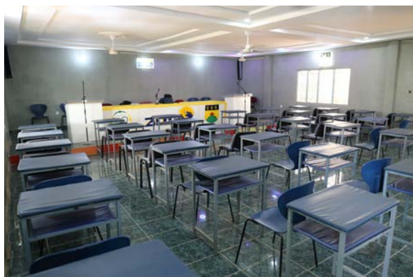
Salle polyvalente (cours, projections et atelier informatique)