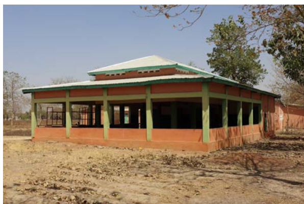
Amphithéâtre pour l'accueil d'ateliers pédagogiques