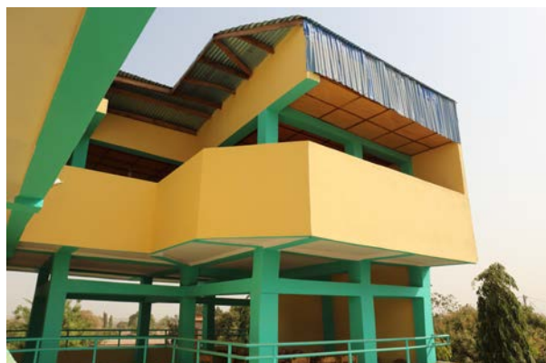
Vue extérieure du Centre et des deux salles de séminaire