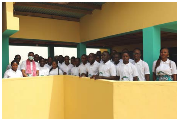
... et aux directions de la FVPT (Alibori, Borgou, Atacora)