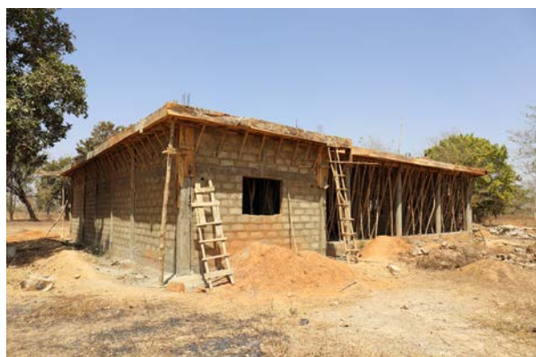
Construction de la future salle polyvalente