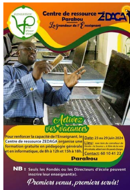
Affiches de la FVPT pour la scolarisation des enfants et la promotion de la santé ainsi que pour la formation en informatique des enseignants