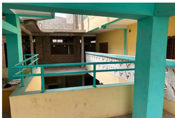
Chantier de l'extension – surélévation (22.02.2025)