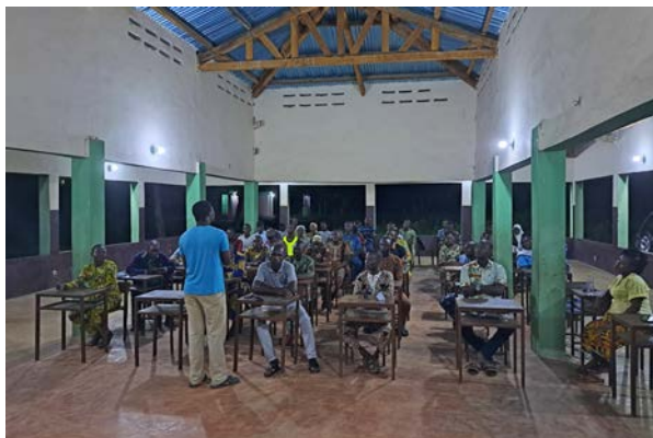
Salle de conférences (12.09.2024)