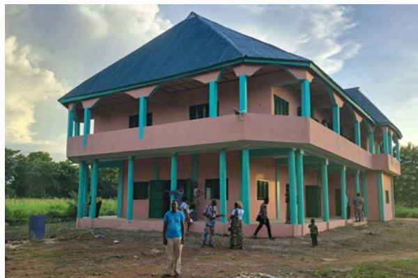
Bâtiment avec extension – surélévation (12.09.2024)