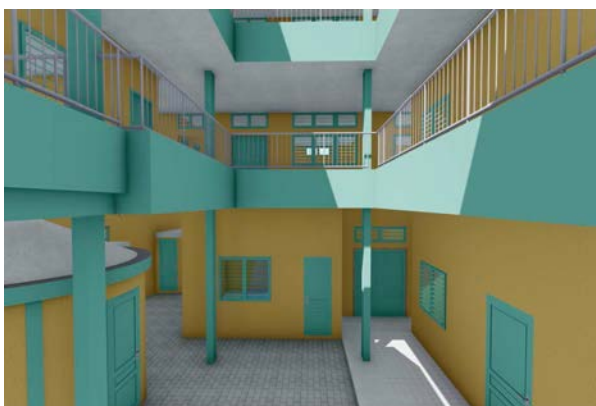
Plan final en 3D du patio et des coursives intérieures