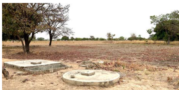
Plan en 3D et terrain mis à disposition par les autorités locales pour le futur Centre de ressources – Tchalinga (23.02.2025)