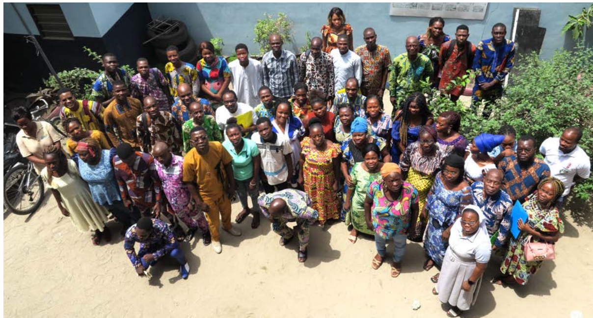
Enseignants primaires de l'arrondissement d'Avotrou-Dandji – Complexe scolaire Planète Éducative – Cotonou (27.02.2025)