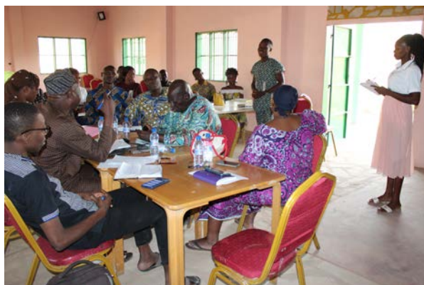
Étudiants en formation propédeutique pour l'entrée en 1 ère année de licence professionnelle – Banikoara (08.02.2025)